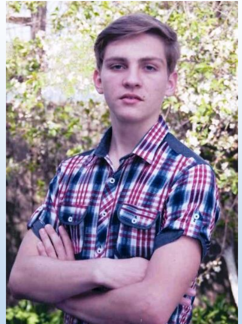
Материал подготовила Храпочкина Полина

посещаю уроки, общаюсь с одноклассниками, принимаю участие в разных мероприятиях». Надо заметить, что делает он это плодотворно!